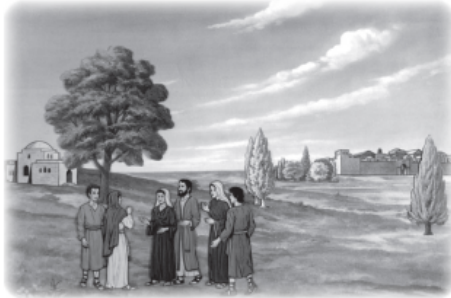
Remove men. Show Orphah (106B) leaving.