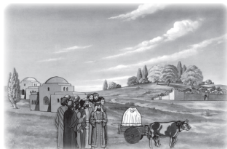
Show ark in front of Dagon (242).