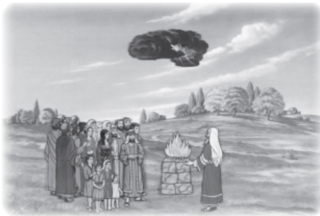
Add dark cloud with lightning.