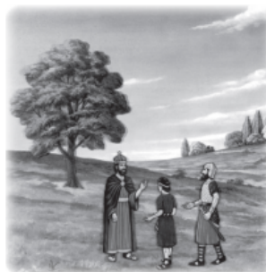
Optional: women singing (97A) to Saul and David.