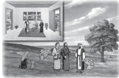
Inset: Birth of Obed