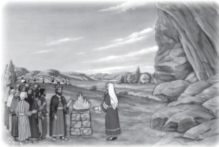
Place hillside scene over desert background. Use rock from cave scene.