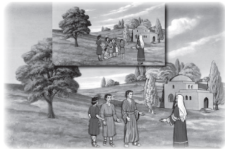
Add anointing oil vial (331) Show lost donkeys (153).