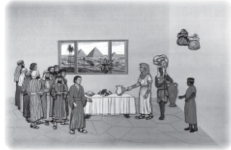
Show steward (65), grain sack, money and cup in order. Add Benjamin (12b) and table with food last.