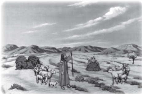
Switch rod for snake. Show Aaron (35) meeting Moses.