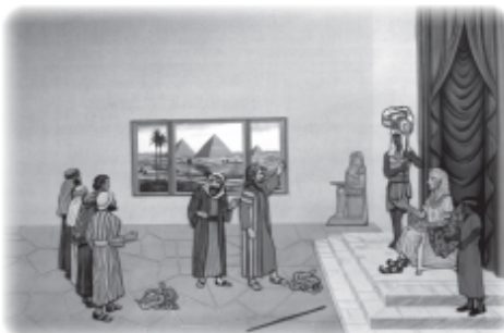
Replace Aaron's rod with snake.