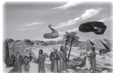
Show plagues sequentially; add blood on door.