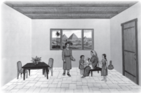
Show Amram & Jochebed praying.